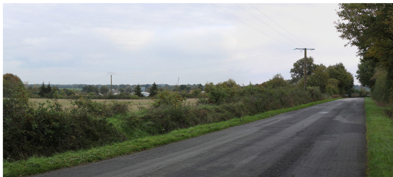
Photographie de l'état initial à 50°